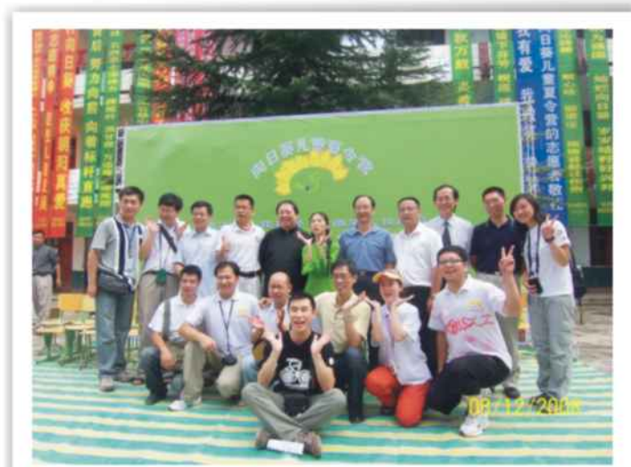
项目工作人员合影